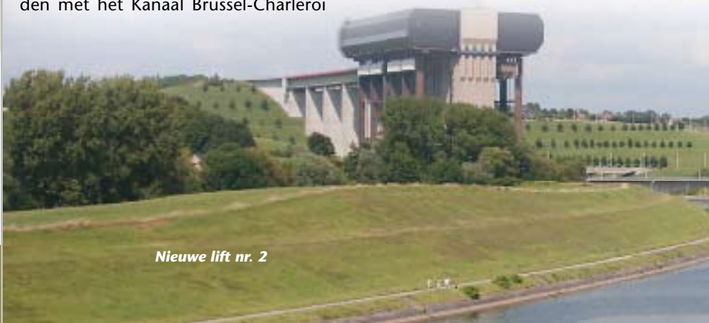
Nieuwe lift nr. 2

via het Centrumkanaal. Zoals overal in België lopen langs de kanalen vrij goede jaagpaden, voorbehouden aan fietsers. Hier volgen we een stukje van de RAVeL1-centre langs het Oud Centrumkanaal en de RAVeL 1bis langs het Nieuw Centrumkanaal. Vanaf het station La Louvière is het 500 meter naar het stadscentrum en de dienst toerisme, waar je een fiets kunt huren. Vlakbij is er de verkeersvrije Albert I-straat met heel wat terrasjes. Om het kanaal te bereiken, keer je terug richting station. Onder de sporen volg je de rue Gustave Boel en 1 kilometer verder ben je aan het oude kanaal. Volg dit rechtsaf. Met de auto kun je aan de verkeerswisselaar (Bois de Courrière) van de E19 naar La Louvière rijden. Gemakkelijker volg je de E19 tot afrit 21 Strépy-Thieu - Pays de