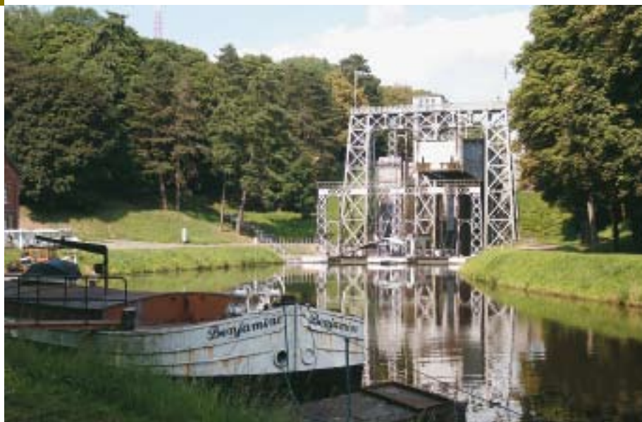
Lift nr. 3

Fietsen langs het water en op oude spoorbeddingen is aangenaam, want je hebt meestal een open landschap en nagenoeg geen last van ander verkeer. Ditmaal volgen we een traject van Oudenaarde naar Kortrijk en keren terug met de trein.