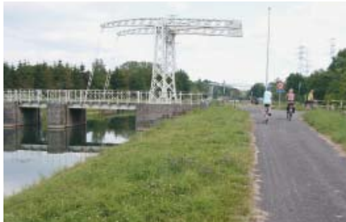
Oud kanaal in Thieu

Na de rue Gustave Boel kun je het kanaal langs beide oevers volgen. Best is de overzijde, dan kom je na 500 meter aan een