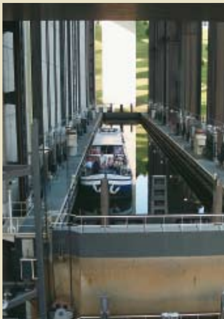
Nieuwe lift in werking

Het Hellend Vlak van Ronquières, op het Kanaal Brussel-Charleroi, is bekend. De scheepsliften op het Centrumkanaal zijn dat nauwelijks, al behoren die tot het werelderfgoed! Ze overbruggen elk 17 meter met uitsluitend water als energie. Ze zijn de enige ter wereld die nog werken, al meer dan honderd jaar, zij het alleen voor toerisme. Voor de scheepvaart werd één nog indrukwekkender lift gebouwd (Strépy-Thieu) op een nieuw kanaal dat op het einde in de lucht hangt. Van op de snelweg van Brussel naar Parijs kun je de lift van Strépy zien. Kom dichtbij, er is een verkeersvrij fietscircuit.