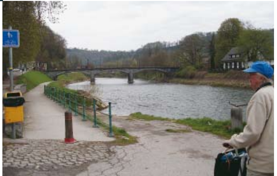
Begin in Comblain-La-Tour

De vallei van de Ourthe is zeer mooi en ook fietsers kunnen ervan genieten: de RAVeL5-route verbindt Comblain-la-Tour met Luik, aan de monding in de Maas. Hogerop ligt een stukje fietspad, tussen Durbuy en Barvaux. De aanleg van dat pad was een dure zaak, omdat er geen jaagpad lag. De afwerking stroomopwaarts is zeker niet voor morgen. Ook een langeafstandsroute van Rando-Vélo volgt de Ourthe: de RV8. Je herkent die aan de geelblauwe strepen.